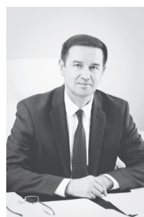
Первый заместитель председателя правительства Ульяновской области А.С. Тюрин

Лидеры фракций «Единой России», КПРФ, ЛДПР и «Коммунистов России» были единодушны в проблематике здравоохранения. КПРФ и ЛДПР добавили вопросы газификации и ЖКХ, «Единая Россия» - дорог, ЛДПР - переселения из аварийного жилья, обеспечения жильем детей-сирот и помощи обманутым дольщикам.